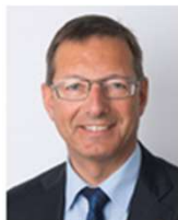
Josef Dittli Präsident des Stiftungsrates Ständerat Kanton Uri